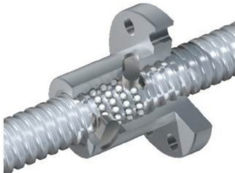
Struktur der Internen Umlenkung Structure of internal circulation

Due to their extremely small dimensions, these assemblies place very high demands on raw materials, heat treatment, grinding processes, and assembly techniques. Manufacturing is significantly more complex.