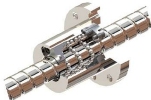
Darstellung Umlenkung mit Endkappenzirkulation Illustration of a deflection with bypass circulation